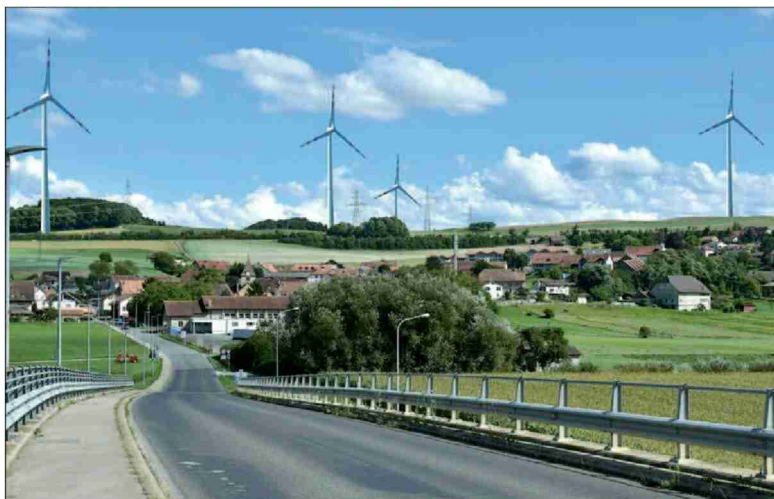
Cette photo-montage montre l'impact sur le paysage de mâts de 230 mètres. Ce qui ne signifie pas qu'ils sont en bonne place. Paysage-Libre Vaud